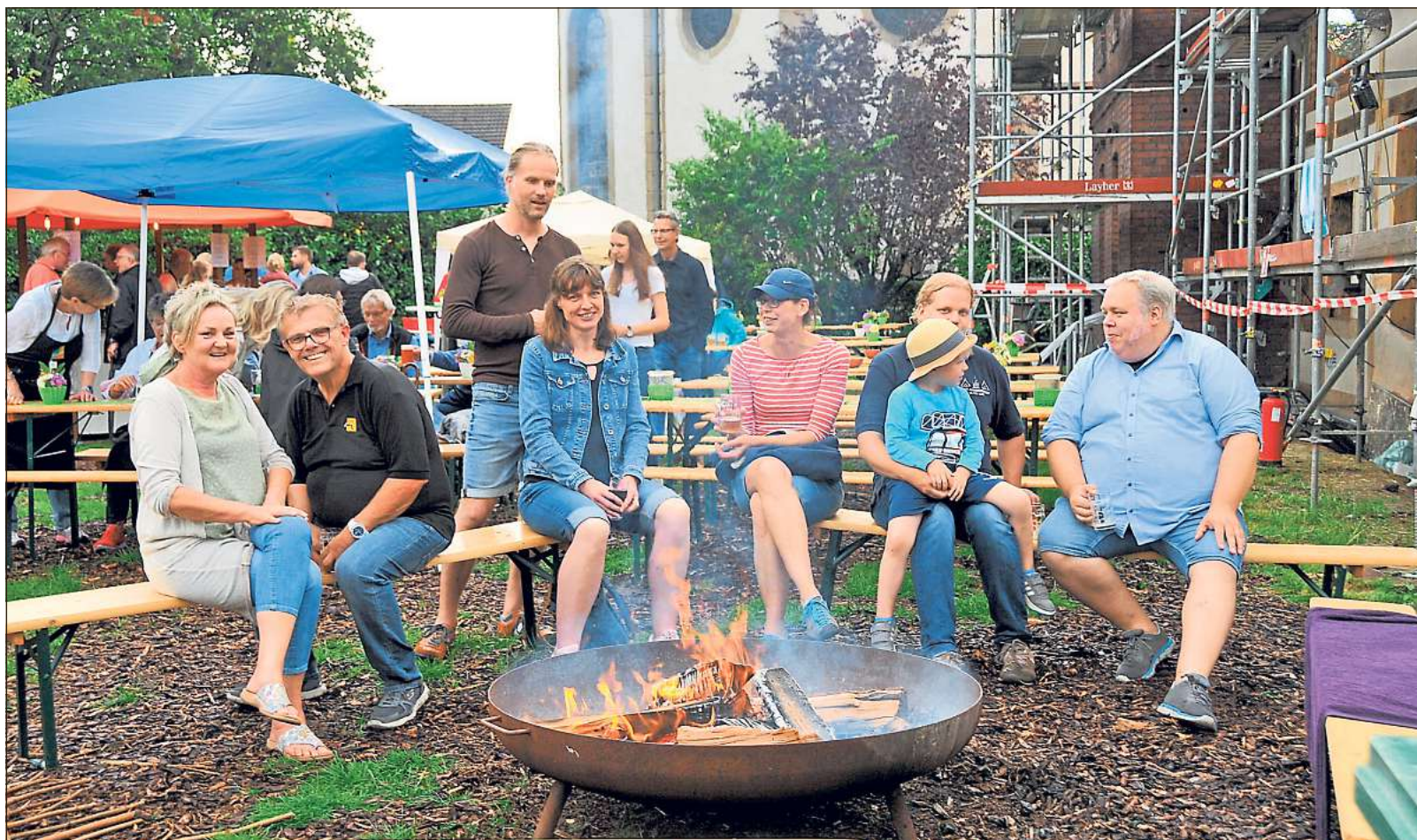
Gemütliche Lagerfeueratmosphäre an der Grillschale, wo sich die Kinder auf dem Sommerfest des Vereins „Dorf aktiv“ in St. Vit auch zwischendurch Stockbrot backen konnten.