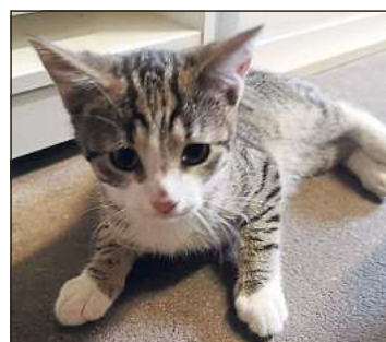
Der junge Kater Han Solo sucht ein dauerhaftes Zuhause.

□ Han Solo ist ungefähr zwölf Wochen alt. Der junge Kater, der ein neues Zuhause sucht, erkundet fröhlich und mutig die Welt. Der kleine Kerl freut sich, wenn er einfach in der Nähe seiner Liebsten sein darf. Gleichzeitig ist Han Solo aber auch abenteuerlustig, springt, tobt und spielt viel. Deshalb wünscht sich das Team vom Pferdeschutzhof „Four Seasons“ am Heideweg in Lintel, wo er zurzeit ein Dach über dem Kopf hat, für den hübschen Kater ein dauerhaftes Zuhause, in dem er auch Freigang genießen kann – das ist auf jeden Fall ein Muss. Der unkomplizierte Kater mag Artgenossen und auch Hunde, kann also ohne Probleme zu Spielgefährten ziehen. Interessenten können sich bei „Four Seasons“ melden unter ☎ 05242/377604.