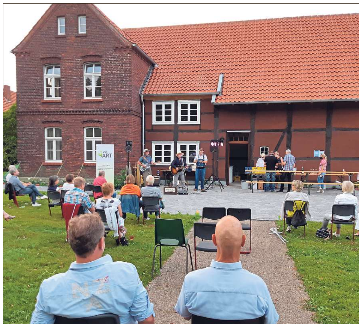
Die Band „Hootin' The Blues“ begeisterte ein musikfreudiges und kulturhungriges Publikum im Garten des Küsterhauses in St. Vit mit Goodtime-Musik. Der Verein Vitart hatte spontan zu einem Wohnzimmerkonzert unter freiem Himmel eingeladen.

Die Drei waren übrigens schon vor drei Jahren einmal zu Gast im Küstergarten. Dass es bei diesem Wohnzimmerkonzert nicht das sonst übliche Fingerfood-Büffet gab, akzeptierten die Besucher verständnisvoll. Mit einem kühlen Getränk gaben sich alle gern zufrieden und genossen den gemütlichen Abend. Die Gäste waren beeindruckt von den Fortschritten der Restaurierungsarbeiten. Führungen waren zwar wegen der laufenden Arbeiten nicht möglich, doch der Sanitärbereich und die Deele konnten schon genutzt werden.