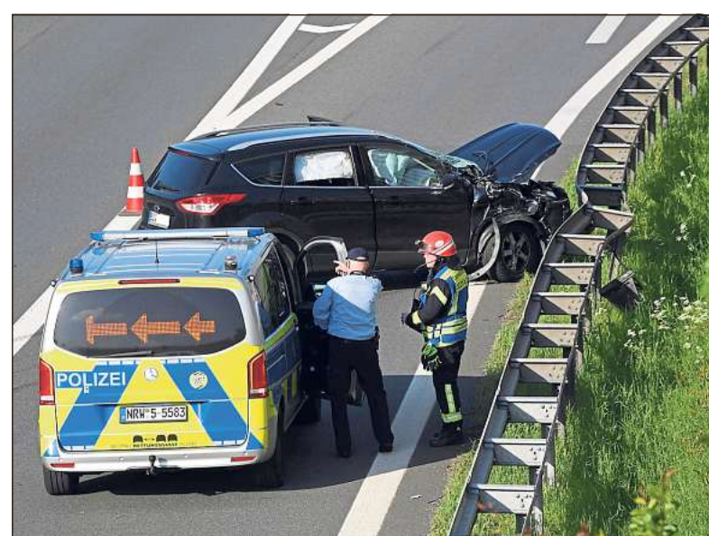
Für eine Stunde musste die Autobahn-Abfahrt in Höhe der Holunderstraße gesperrt werden, nachdem es dort zu einem Unfall zwischen einem Van und einem Lastwagen gekommen war.

Interessenten können sich per E-Mail unter der Adresse buescherjul@gmail.com bei ihm melden. Ein Teil des Erlöses kommt dem Erhalt des Küsterhauses zugute.